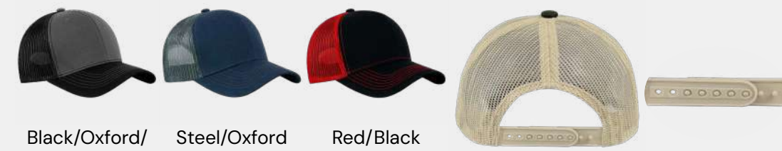
Black/Oxford/Black Steel/Oxford Red/Black