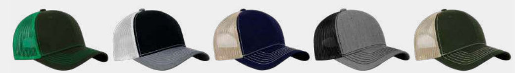
Olive/Green Black/Heather Grey/White Navy/Khaki Heather Grey/Black Olive/Khaki

Horma: H-PRO perfil alto, 6 paneles. Estructura: Rígida. Tipo de tela: Paneles frontales de Algodón. Composición: 60% Algodón, 40% Poliéster. Tipo de malla: Poliéster. Broche: SANPBACK plástico. Visera: Curva. Circunferencia: Unitalla ajustable. Banda de sudor: Poliéster.