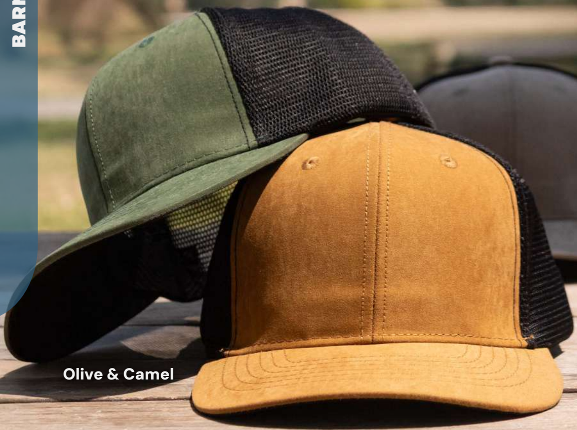
Olive & Camel