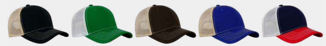
Black/Khaki Green/White Brown/Khaki Royal/Khaki Red/Navy/White