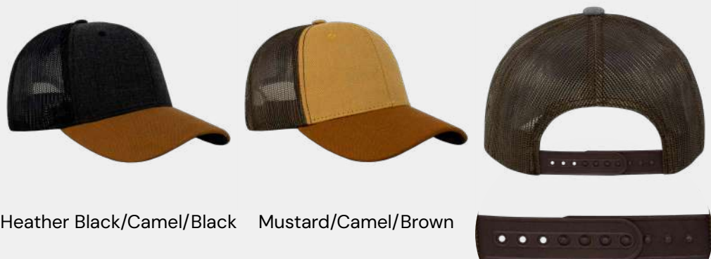
Heather Black/Camel/Black Mustard/Camel/Brown

Composición: 60% Algodón, 40% Poliéster.