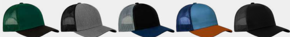
Dk Green/ Oxford/Green